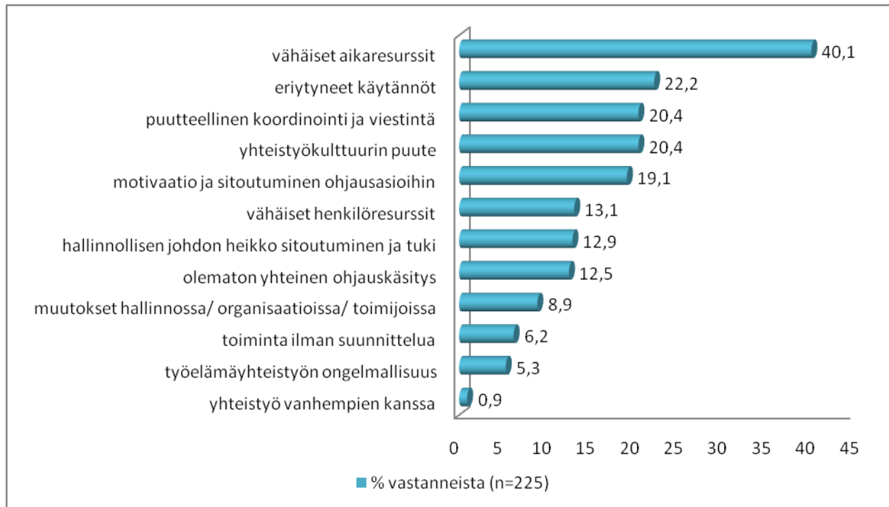
Kuvio 1. Kehittämistyötä vaikeuttavat tekijät.

Vastauksista kävi ilmi myös yhteisen ohjauskäsityksen puute. Kun eri toimijoilla on erilaisia käsityksiä siitä, mitä on ohjaus, on vaikeaa alkaa rakentamaan yhteistä toimintasuunnitelmaa: