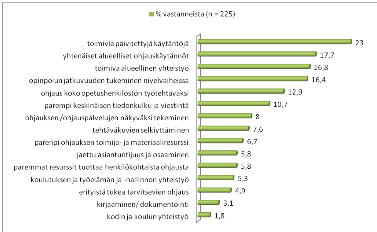
Kuvio 2. Kehittämistyöhön liittyvät odotukset.

liittyivät keskinäiseen viestintään sekä eri toimijoiden kesken että ohjausta koskevassa paikallisessa päätöksenteossa.