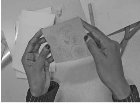
Minun kirjani -projekti.

toimi projekteissa kohtaamispisteenä ihmisten ja kulttuureiden kesken. Samalla huomattiin, ettei taiteen tekemiseen ja kokemiseen tarvita muuta kuin avointa asennetta ja uskallusta ammentaa omista näkemyksistä.