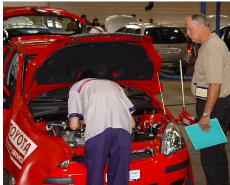
Kuva: Matti Tukiainen