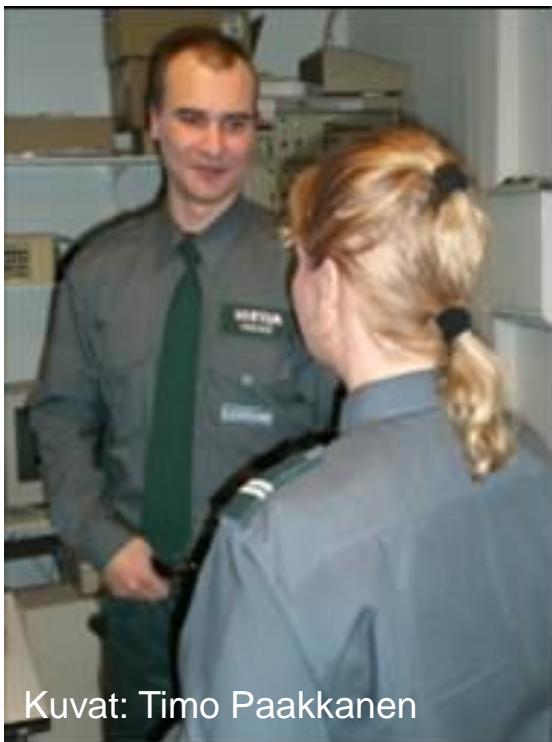
Kuvat: Timo Paakkanen