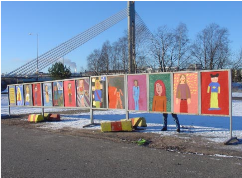
Tulevaisuuden rovaniemeläinen. Rovaniemen kuvataidekoulun 6–19-vuotiaiden oppilaiden näkemyksiä.