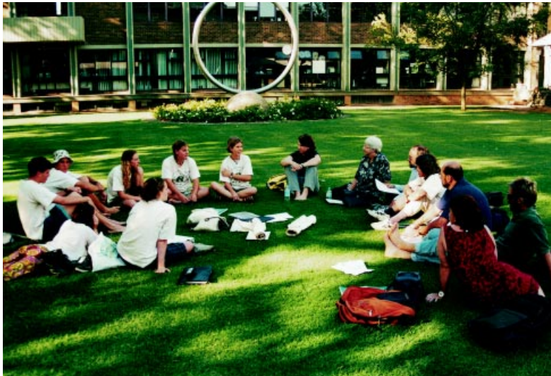
ENSI-hankkeen SEED-projektin opettajat kansainvälisellä täydennyskoulutuskursilla.