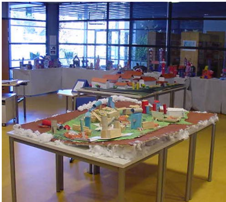
Lasten suunnitelma Pajuniityn rakentamisesta.