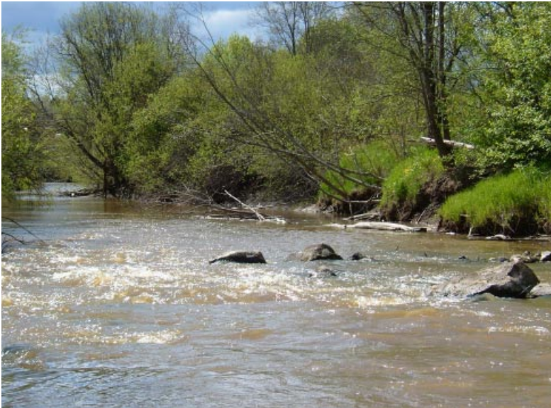
Lemmenjokiakson luonnonsuojelualueen keväistä kauneutta.